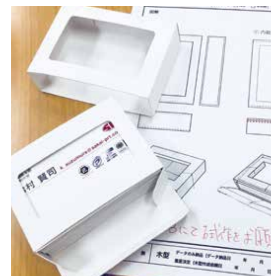
試作中です。次号にて発表！

みなさんこんにちは！企画制作室の鈴村です！早いもので気がつけば3月です。4月からは、新社会人として入社を控えている方も多いのではないのでしょうか。そんなみなさまに、名刺交換にインパクトを与えるご提案。「本格的なマジックショーが出来る紙製カードケース」を考えております。前回のVol.15でご紹介したカードケースより、さらに細工を凝らした設計で考え中です。次号にて発表いたしますので、お待ちください。お楽しみに！