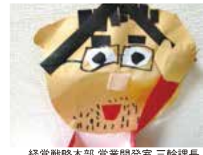
経営戦略本部 営業開発室 三輪課長

私はゴルフが趣味なのですが、新規でお問い合わせをいただいた『B2 ファクトリー』様の新商品のパッケージとWEB制作を担当することに、『MANPOTE TUBE』という所謂ゴルフスイング強化ツールなのですがこれがスゴイ!!商品開発をされたのがプロゴルファーの石川遼や松山英樹、藤本佳則といった日本を代表するツアープロを指導している秀島正芳氏が率いるトレーナー軍団!装着してスイングするだけで30yard 飛距離が伸びるという全てのゴルファーにとっての夢のような商品。次回、機会がありましたら実際に使用した商品レビューをお届けしようと思っております。それまで待てない方、興味のある方は是非右記のQRコードからアクセスしてください!