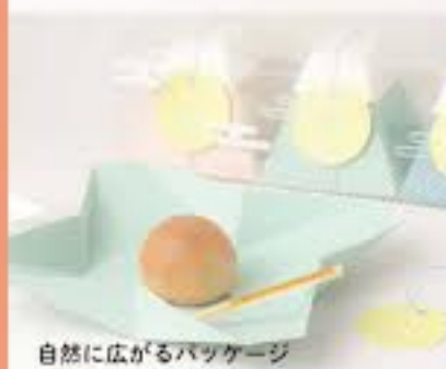
自然に広がるパッケージ

日本では昔から星のことを●で表現していました。海外で採られる星に比べて個ましい●を使った夜空で夜のしじまをデザインしています。中から覗くことで星の光だけが存在するしじまの世界を体験することができます。