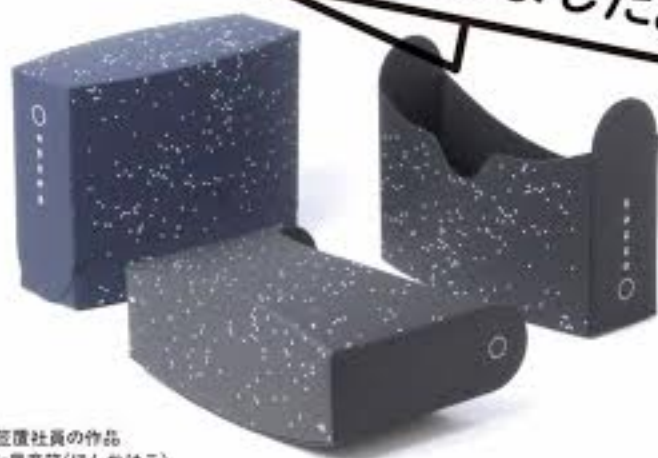
弊社 空置社員の作品 作品名: 星音箱(ほしねはこ) テーマ: しじま

「いただきます」の語源である、山の一番高い所を指す「頂き」という言葉を元に富士山の頂きパッケージを制作しました。 蓋を開けるとパッケージが自然に開きそのまま片手でも食べやすい仕様になっています。