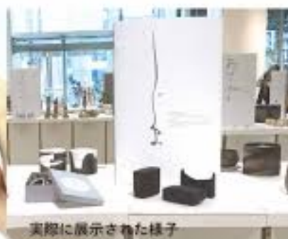
実際に展示された様子