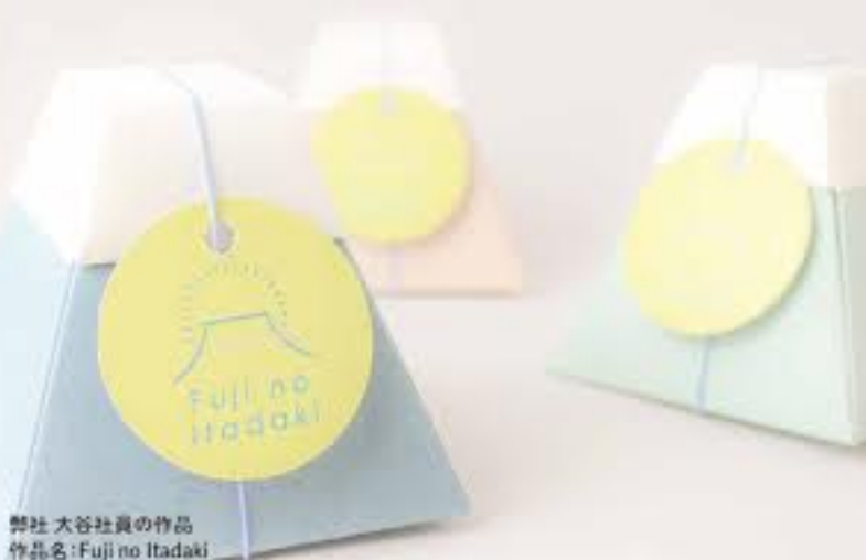
弊社 大谷社員の作品 作品名: Fuji no Itadaki テーマ: いただきます

「いただきます」の語源である、山の一番高い所を指す「頂き」という言葉を元に富士山の頂きパッケージを制作しました。 蓋を開けるとパッケージが自然に開きそのまま片手でも食べやすい仕様になっています。