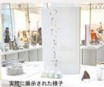
実際に展示された様子