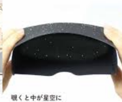
覗くと中が星空に