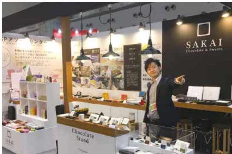
写真は、当日のブースの様子です。チョコレート専門店をイメージしたブースデザインは社内外で好評をいただきました。

2017年4月12日～14日の3日間、東京ビッグサイトで開催された第14回デザート・スイーツ&ベーカリー展に出展いたしました。インテックス大阪でも出展いたしましたが、テーマは同じく「安心・安全」。連日多くの来場者の方にお越しいただき、大盛況のうちに展示会を終えることができました。お越しいただきましたみなさま、誠にありがとうございました！