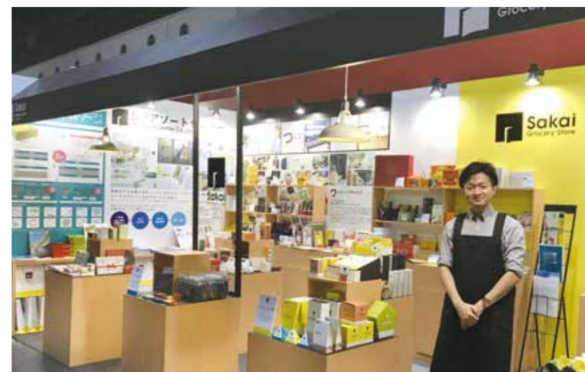
写真は、ブース準備中の様子です。

2017年10月11日～10月13日の3日間、インテックス大阪にて開催された、第5回 関西デザート・スイーツ & ベーカリー展(ファベックス関西2017)に出展いたしました。関西の食品業界に特化した展示会で、弊社は今回で3度目の出展となります。今回から、黄色がアクセントのフレッシュなブースデザインにリニューアル！トレンドのグロサリーストア(※食品品雑貨店)をイメージした構成で、オリジナルパッケージや制作実績、成形品や抗菌板紙など、ワンストップサービスを中心に弊社をご紹介いたしました。連日多くの来場者の方にお越しいただき、大盛況のうちに展示会を終えることができました。お越しいただきましたみなさま、誠にありがとうございました！