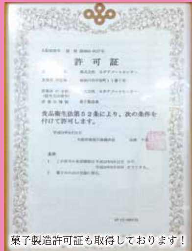
菓子製造許可証も取得しております！

作業スペースでは、食品工場白衣で作業している従業員が25名程おります。キャップ・マスク・手袋着用なので食品の取り扱いも安心です。また、封入作業では金属探知機を用いるため、金属片などの異物混入リスクも低減できます。