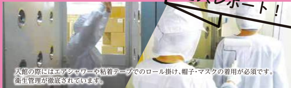
入館の際にはエアシャワーや粘着テープでのロール掛け、帽子・マスクの着用が必須です。衛生管理が徹底されています。