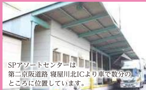
SPアソートセンターは第二京阪道路 寝屋川北ICより車で数分のところに位置しています。